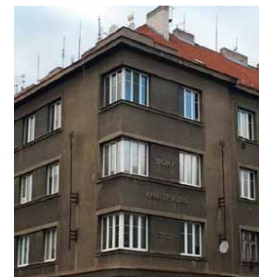
Domy knihtiskařů – Praha, Strašnice

Po vzniku samostatného Československa v průběhu let 1918–1938 byla činnost družstev přínosem při další výstavbě a zkvalitňování bydlení. Ve velkých počtech vznikala nová stavební a bytová družstva, mnohá z nich na profesním principu. Příkladem mohou být domy knihtiskařů v Praze v Strašnicích či Podolí, které vznikaly na počátku 30. let.