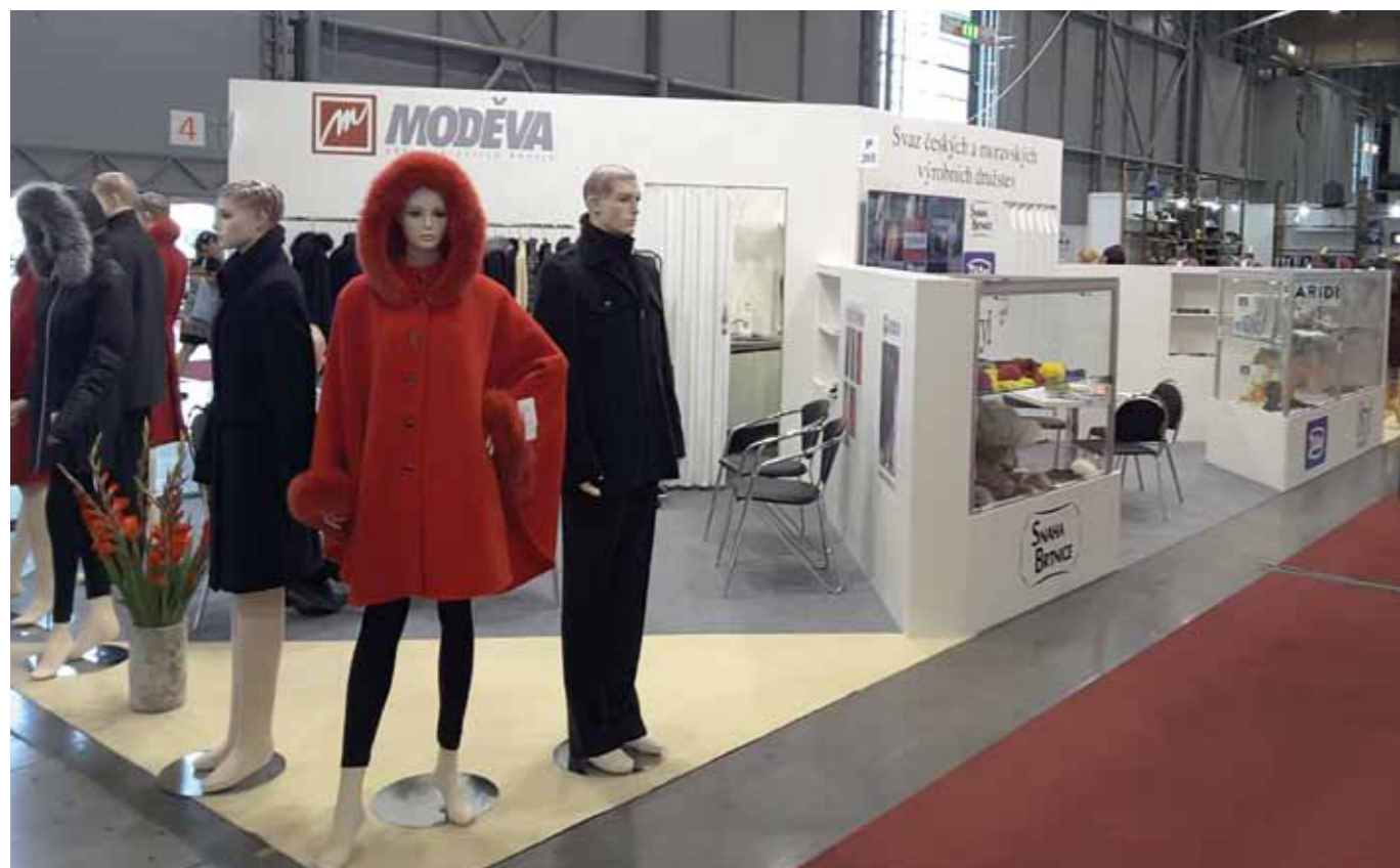
Společná expozice výrobních družstev na mezinárodním veletrhu módy STYL v Brně

přináší výrobním družstvům mimo jiné také možnost vzájemné výrobní kooperace s dalšími českými a moravskými výrobními družstvy i navázání spolupráce a kooperací s družstvy ze zahraničí. Do organizační činnosti svazu patří také společné účasti členských družstev na předních českých i zahraničních výstavách a veletrzích. Družstva se v loňském roce pod záštitou svazu zúčastnila mezinárodních veletrhů módy a koženého zboží Styl a Kabo v Brně, největšího světového veletrhu hraček a potřeb pro děti Spielwarenmesse v Norimberku nebo agrolonu Země živilka v Českých Budějovicích.