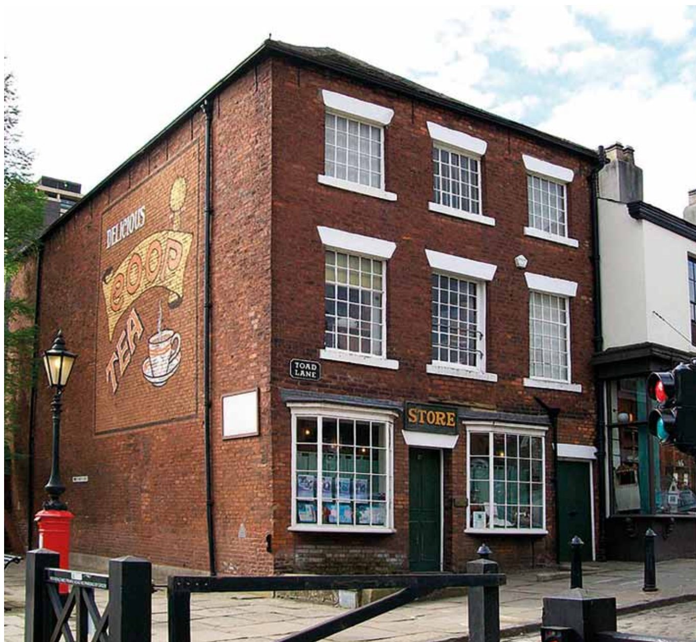
Budova, kde byla prodejna družstva

Rochdaleské principy se postupně modernizovaly a přizpůsobovaly společensko-ekonomickým podmínkám jednotlivých zemí a dodnes jsou považovány za „družstevní abecedu“ světového družstevního hnutí pro všechny typy družstev.