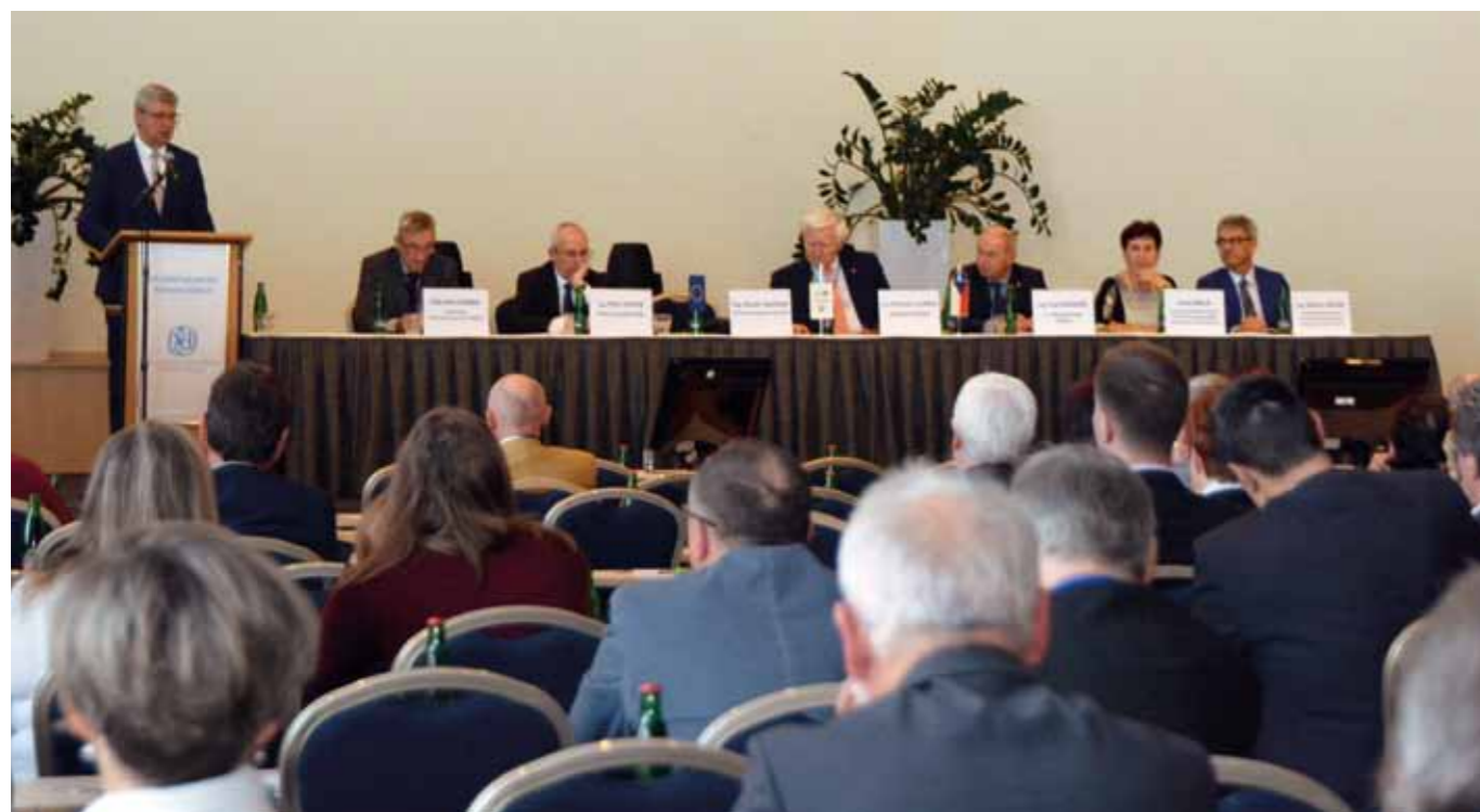
Celorepubliková porada SČMVD 2019

Svaz členskými družstvy zajišťuje společné nákupy, které jim snižují náklady a zvyšují tak jejich konkurenceschopnost. Členství ve svazu