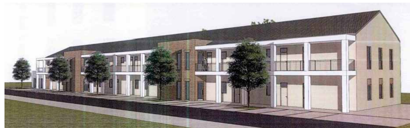
SBD Rozvoj Opava – bytový dům Malé Hoštice