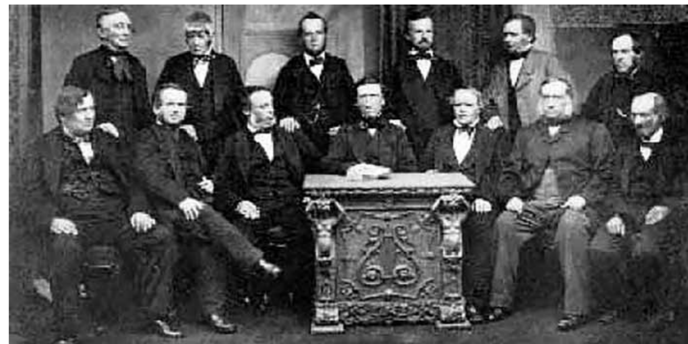
Předsednictva rochdalekého družstva

Tak nejprve zvolna, ale potom již velice rychle začal vyrůstat ze zdánlivě bezvýznamného podniku „bláznivých tkalců“, jak byl mnohými posměváčky zpočátku označován, jeden z největších družstevních podniků v Anglii. Pod vlivem činnosti tohoto družstva byly pozměněny i některé anglické zákony, které původně značně omezovaly družstevní činnost. Po celou dobu své činnosti družstvo respektovalo zásadu levného zásobování a ani v jednom případě nezvýšilo svoje ceny za účelem většího zisku. Z necelých 3 desítek prvních členů se do konce 60. let 20. století rozrostlo na družstvo s více než 50 000 členy. Bohužel na začátku 80. let 20. století byla činnost družstva ukončena, když se v roce 1982 spojilo s dynamičtějším sousedním spotřebním družstvem Norwest.