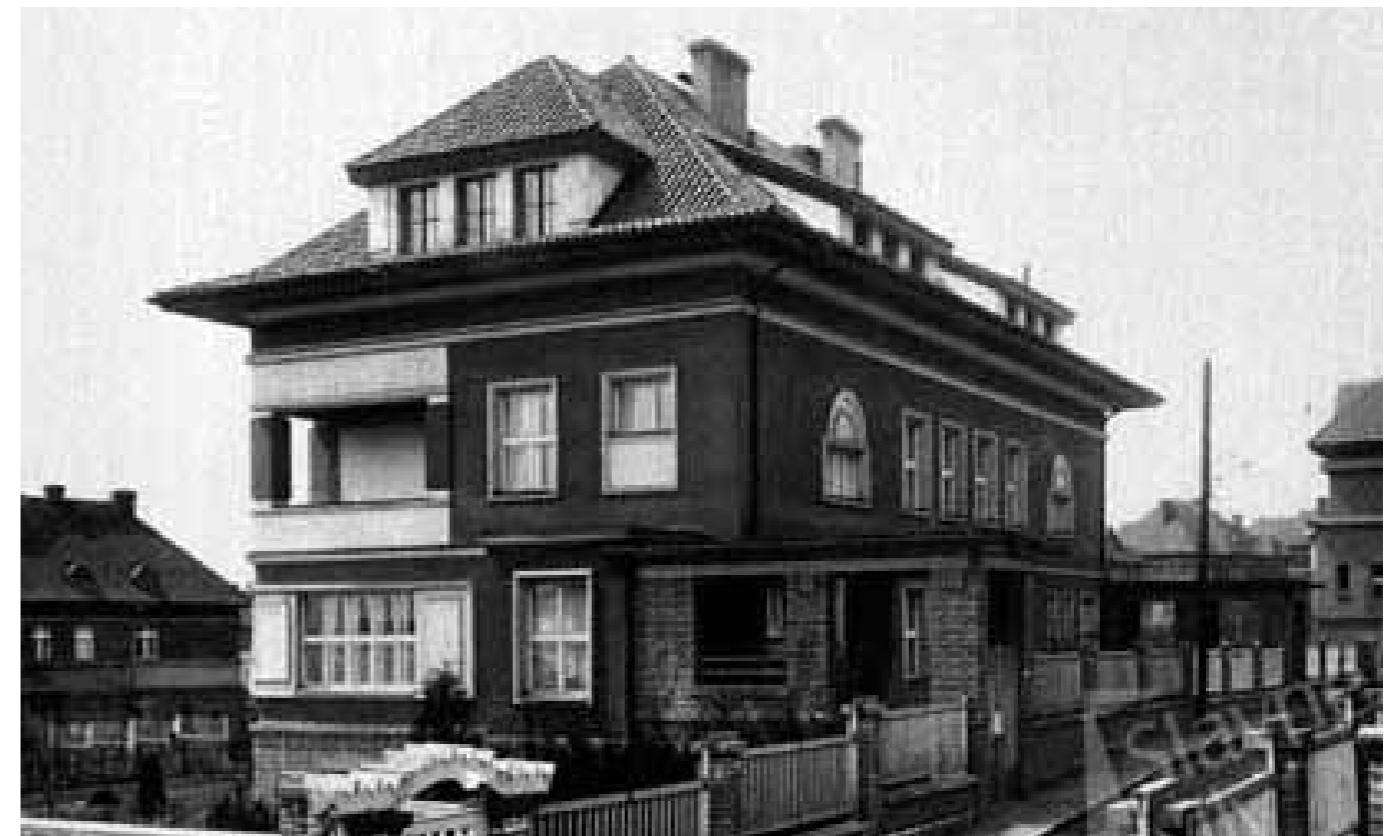
Vila bratří Čapků – Praha, Vinohrady

Svaz českých a moravských bytových družstev je členem pracovní skupiny, která připravuje Konceptci bydlení 2021+, tj. koncepci bydlení v České republice do roku 2030. S lehkým optimismem můžeme konstatovat, že poprvé od roku 1989 se v obdobném dokumentu (v jeho návrhu) hovoří o družstevní formě bydlení pozitivně. Tato připravovaná koncepce má být založena na třech pilířích, tj. vlastnickém, nájemním a družstevním bydlení. Poprvé po 30 letech se tak družstevní bydlení dostalo do sféry zájmu dotčených orgánů, které mu tak přiznávají nezanedbatelnou roli v segmentu poskytování dostupného bydlení. Věříme, že toto je pouze první krůček k obnovení renomé bytových družstev jako jedné z hlavních forem bydlení. Bytová družstva jsou připravena se vedle své hlavní činnosti, kterou je správa stávajícího bytového fondu, vrátit také k samé podstatě, kterou má většina z nich uvedenu ve svém názvu – tj. stavební bytové družstvo.