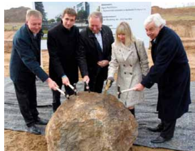
SBD Pelhřimov – bytový dům Pacov – zahájení výstavby

V případě družstevní výstavby se nemusí vždy jednat o výstavbu na zelené louce. SBD Rozvoj Opava zpracovalo studii na přestavbu nevyužívaného komerčního objektu v Malých Hošticích (předměstí Opavy). Cílem tohoto projektu je nejen vybudování 18 bytových jednotek v dispozici 1+KK až 3+1 o velikostech 49–83 m 2 a příslušného počtu parkovacích stání, ale také oživení dlouhodobě nevyužívaného objektu a revitalizace souvisejícího veřejného prostoru.