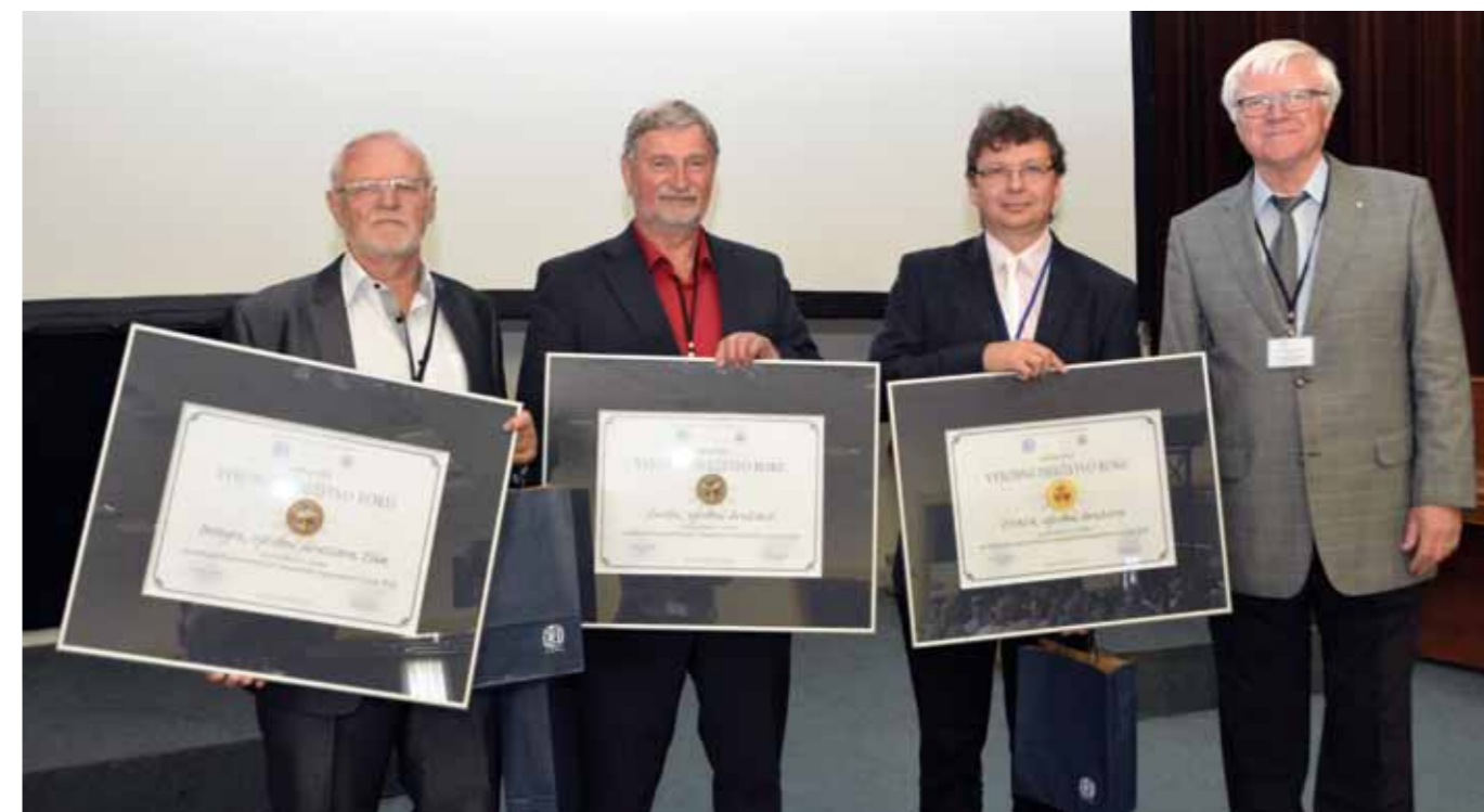
SČMVD Výrobní družstvo roku 2018, kategorie družstev zaměstnávajících osoby se zdravotním postižením