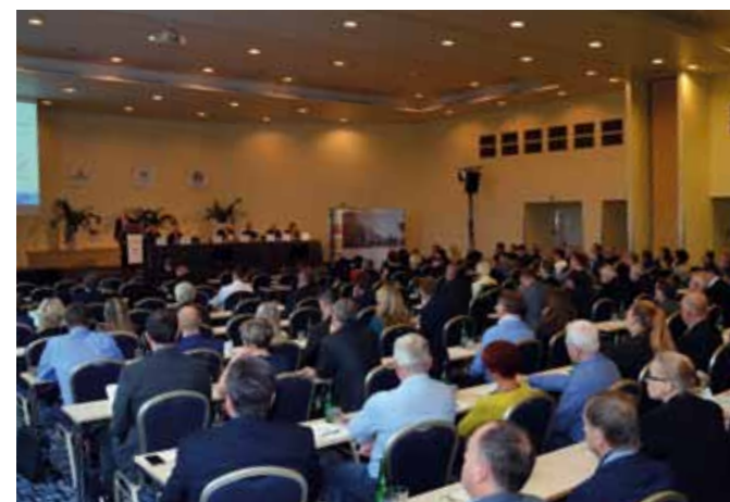
Celorepubliková porada SČMVD

Svaz členským družstvům zajišťuje společné nákupy, které snižují náklady družstev a zvyšují tak jejich konkurenceschopnost. Členství ve svazu přináší výrobním družstvům mimo jiné také možnost vzájem-