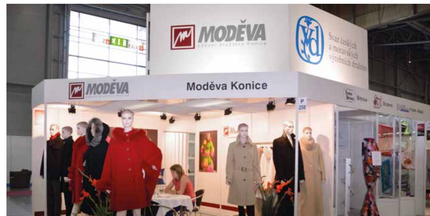
Společná expozice výrobních družstev na mezinárodním veletrhu módy STYL v Brně

Svaz a další zástupci zaměstnavatelů proto již více než 25 let kontinuálně upozorňují vlády a všechny státní instituce v České republice na destrukci středního technického a učňovského školství, kterou do této oblasti vnesla především 90. léta. Přes stovky a tisíce návrhů a stanovisek, které byly jejich prostřednictvím předloženy, se však téměř nic nezměnilo, destrukce stále pokračuje a stav se zhoršuje. Školy neprodukují absolventy s potřebným vzděláním v dostatečném počtu a v některých oborech, jako jsou například strojírenství, stavebnictví nebo textilní a oděvní výroba, je situace více než kritická. Svaz proto pokládá vyřešení tohoto stavu za zcela rozhodující a navrhuje stanovení kvalitativních limitů pro střední a vysoké školy v České republice, které dokáží eliminovat nepřijatelné počty nepotřebných středních a vysokých škol, a to těch, které neprodukují pro společnost absolventy v potřebných oborech. Usiluje o omezení počtu těchto nepotřebných absolventů, i formou změny financování škol podle jejich uplatnitelnosti, a navrácení se k učňovským oborům zajišťujícím přípravu pracovníků v řemeslech, která naopak české hospodářství zoufale potřebuje.