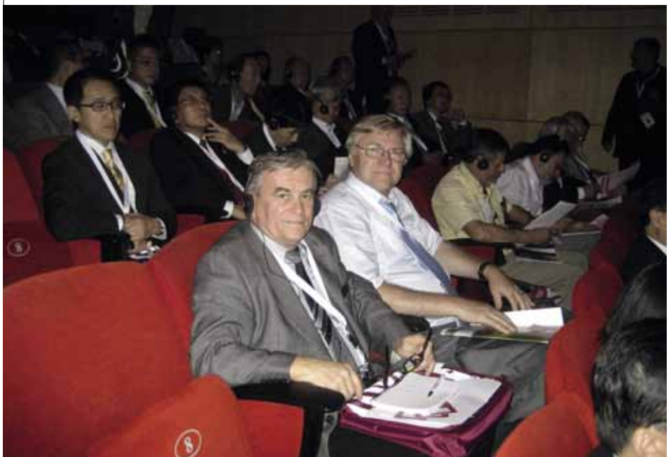
VS MDS – členové české delegace

V době od 11,00 do 12,30 pokračovalo (z předchozího dne) jednání tří pracovních seminářů, které byly