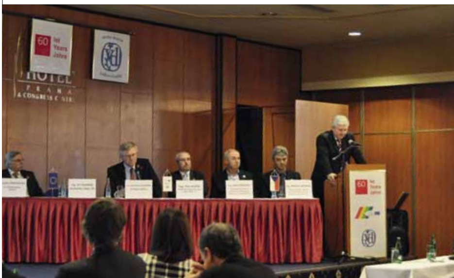
Celorepubliková porada SČMVD – vystoupení předsedy vlády ČR