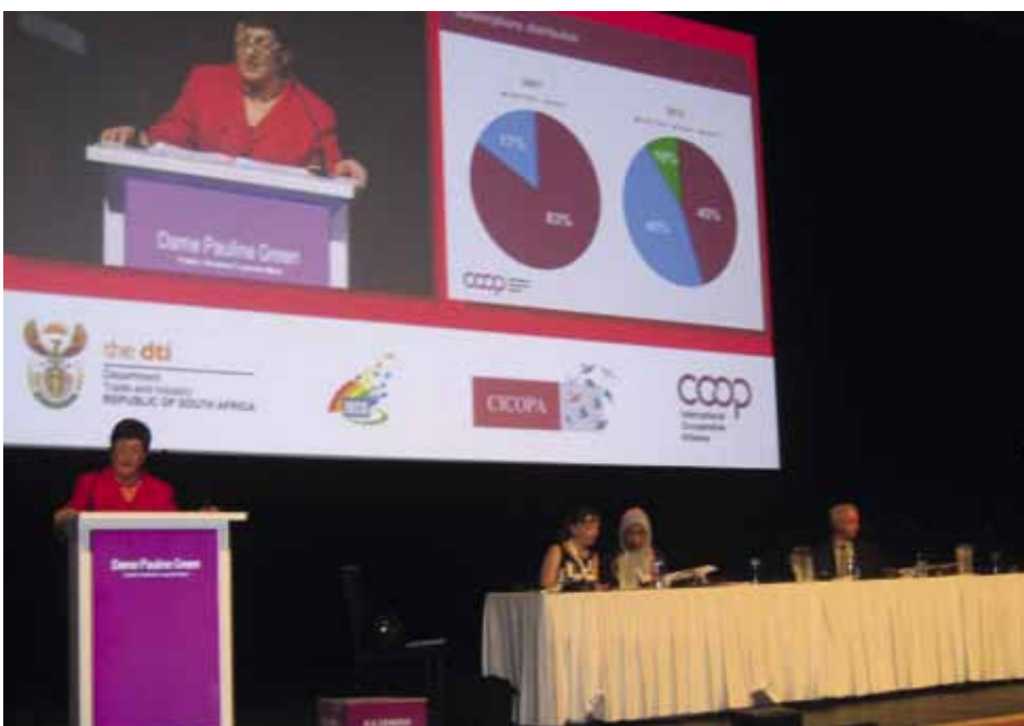
VS MDS – vystoupení prezidentky Pauline Green

Vyhlášení výsledků voleb si vyžádalo více času, než se předpokládalo na jejich sečtení. Pokud jde o zastoupení výchoevropských států v předsta-