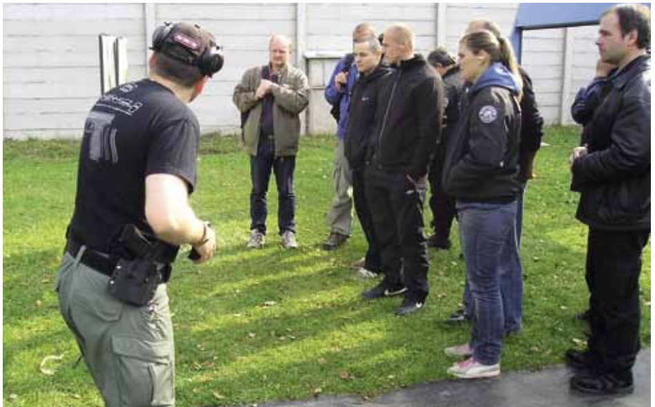
Instruktor před střeleckým výcvikem

Cílem je proškolení 897 pracovníků ostrahy k vykonání zkoušky odborné způsobilosti pro profesní kvalifikaci „Strážný“ – č. 68-008-E a dále ověření odborné způsobilosti absolventů školení zkouškou podle zákona č. 179/2008 Sb. o uznávání výsledků dalšího vzdělávání.