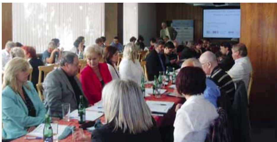
Konference se zúčastnilo přes 100 účastníků, zejména z řad spotřebních družstev a středních odborných škol SČMSD

Sektorová rada pro obchod a marketing má aktuálně ve své gesci 7 profesních kvalifikací, které jsou zveřejněny v rámci NSK. V roce 2012 tvorba dalších profesních kvalifikací pokračuje na základě návrhů sektorové rady ve vztahu k vytvořeným jednotkám práce.