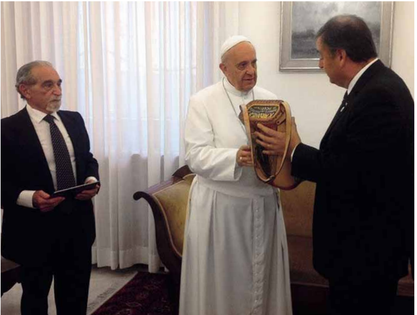
Předání daru papežovi

František svou podporu družstvům, která vnímá jako rozhodující prvek světové ekonomiky budoucnosti. Připomenul jejich roli v současné ekonomické krizi, kdy lidé umírají hladem a zimou a kdy i v zemích vnímaných jako silně rozvinuté, jakými např. jsou Španělsko a Itálie, dosahuje nezaměstnanost mládeže 40 %. Vzpomenul i na svého otce, který již r. 1945 diskutoval o vlivu družstev na místní komunity.