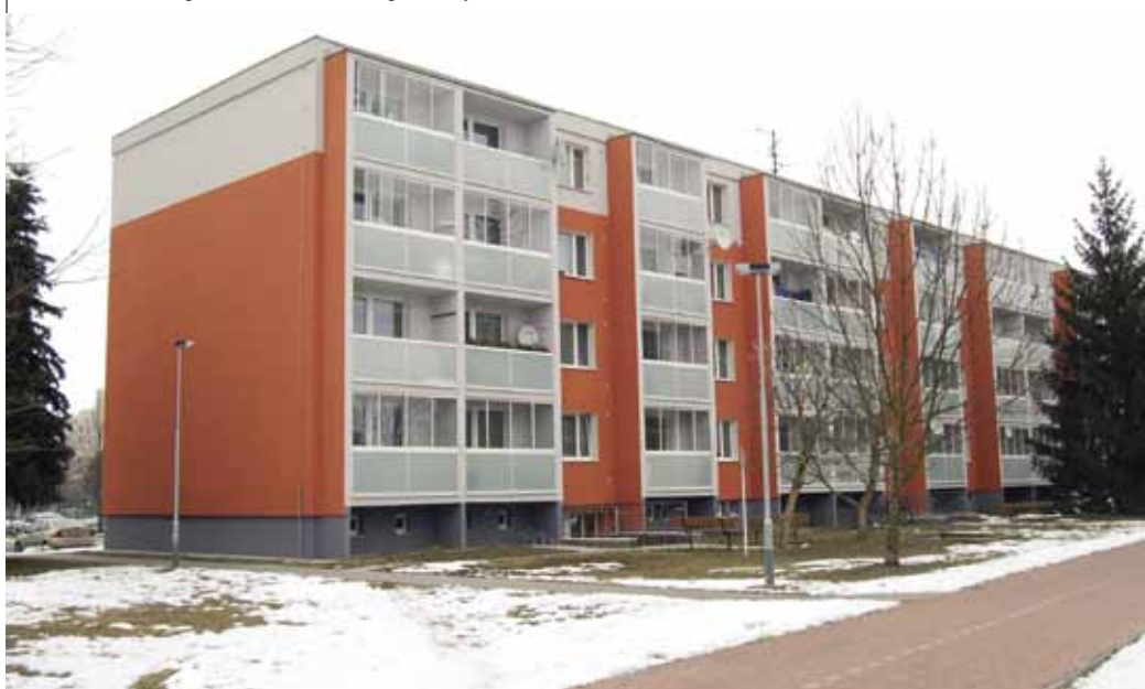
OSBD Olomouc- příklad modernizace panelových domů

Odhadujeme, že společně s dokončením 1. etapy oprav a modernizací bytových domů je možno reálně očekávat potřebu prací v řádu 190 – 270 mld. Kč. To, zda budou tyto činnosti skutečně realizovány, bude záležet nejenom na finanční situaci, potřebách a znalostech vlastníků a uživatelů bytů, ale také na ekonomické situaci státu v příštích letech a na jeho ochotě uvedená opatření podpořit. Zkušenosti s minulými či stávajícími dotačními tituly potvrzují, že účast státu ve formě rozumného a dlouhodobého dotačního programu může výrazným způsobem zvednout zájem občanů o dané téma. Z pohledu státu je pak možné očekávat za relativně nízkou cenu velké výsledky.